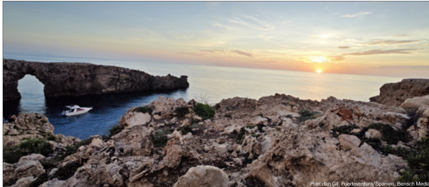
Pont den Gil, Fuerteventura/Spanien

Praktika sind ein wichtiger Bestandteil vieler Umschulungsmaßnahmen, um praktische Erfahrungen im neu-